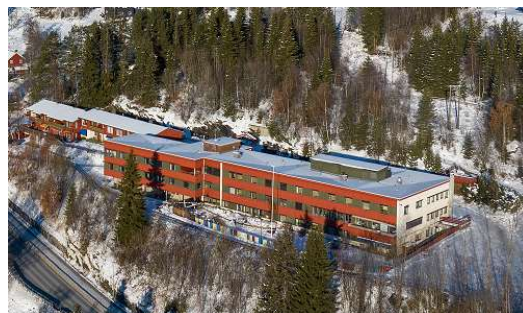
Foto 1: Den gamle sjukeheimen ligg på Øvre Moen rett overfor Heggenes sentrum

Øystre Slidre kommune har fått eit tilskot frå Husbanken for å gjennomføre ein moglegheitsstudie for å bidra til auka bustader i distriktkommunar, og meir spesifikt for å sjå på og avklare potensielle løysingar for transformasjon og vidare bruk av institusjonslokala til gamle Øystre Slidre sjukeheim i Moavegen 38. Kommunen tok i bruk nytt helsetun i 2021. Det har medført at den