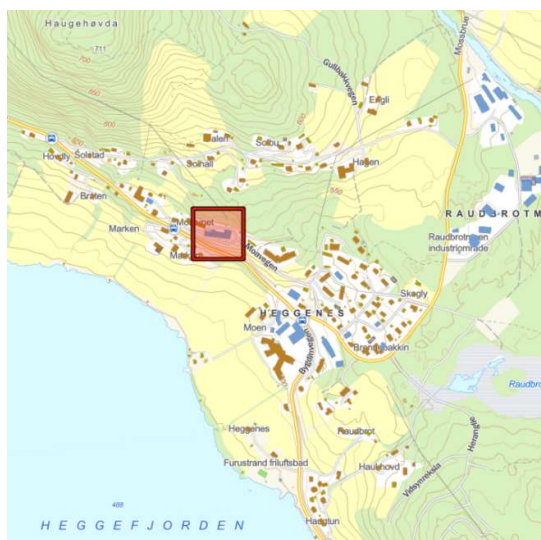
Figur 1: Plassering av eigedomen er markert i raudt. Eigedomen og bygningsmassane er lokalisert som ein del av sentrum, med gangavstand til butikkar m.m.