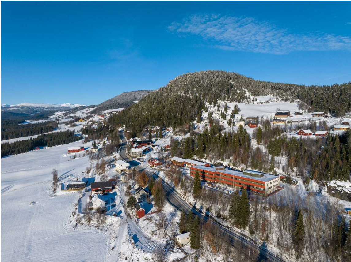
Oversiktsbilete av den gamle sjukeheimen i Heggenes.

Transformasjon og vidare bruk av institusjonslokala til Øystre Slidre sjukeheim