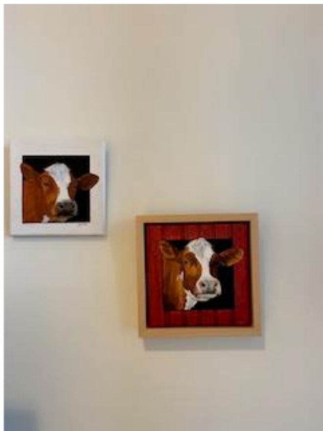
To kyr som tittar ut stogo B