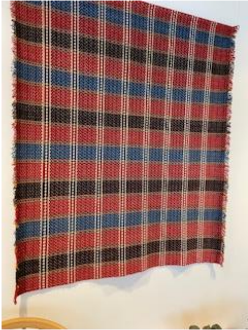
Kristneteppe gjeve i gåve, Stogo B