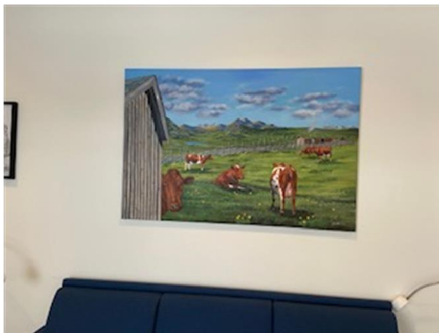
Støl og kyr, bestillingsverk til nye helsetunet i 2022 Stogo A