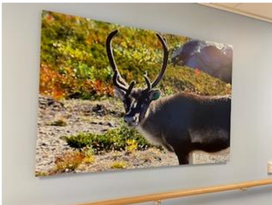
Reinsdyret ved Glitterheim