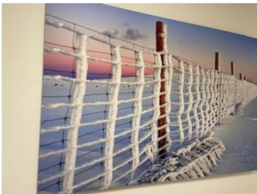
Reinsgjerdet på Valdresflye