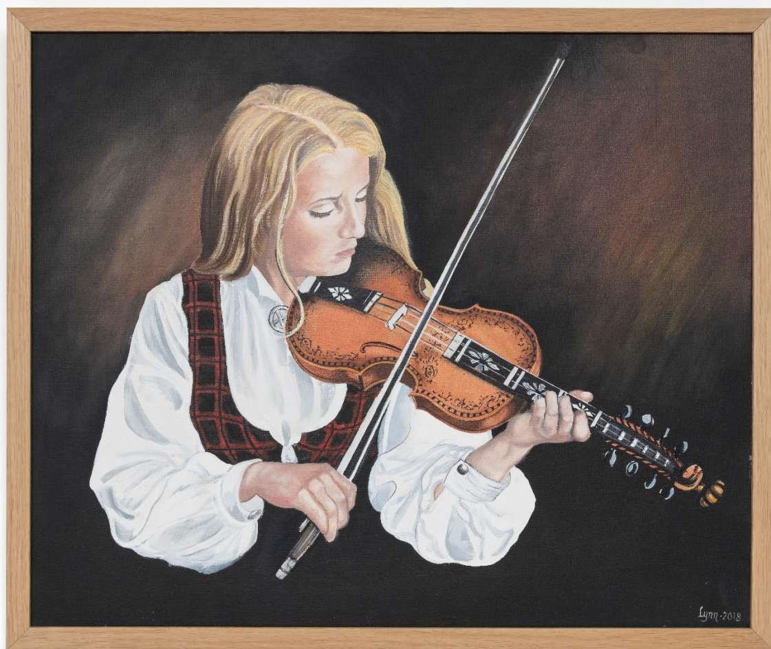
og felespelande jente