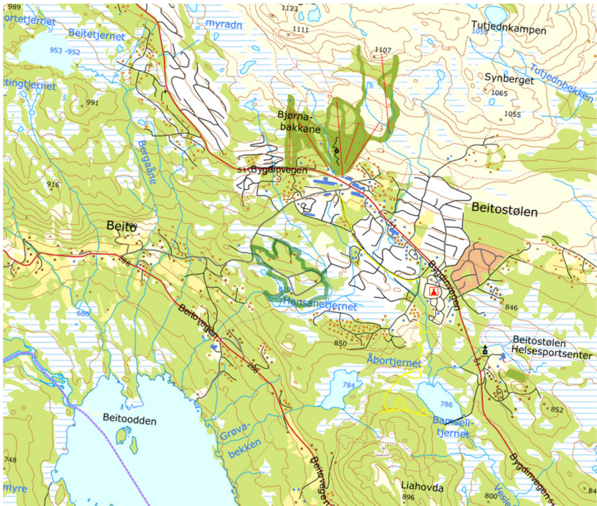
Fig.1: Planområdet si beliggenheit vist med grønt

Planområdet ligg rundt 840 moh. og omfattar sørsida av ein haug mellom Beitostølen og Beito. Området er avgrensa av Beitostølsvegen i vest og skog og myr på dei andre kantane. Området er bjørkeskog og myr, delvis utbygd av bustader. Området er regulert til bustadområde i dag. Infrastruktur som veg og gatebelysning, vatn, avløp, elektrisitet og fiber er opparbeidd. Vegtilkomsten er frå Beitostølsvegen i vest.