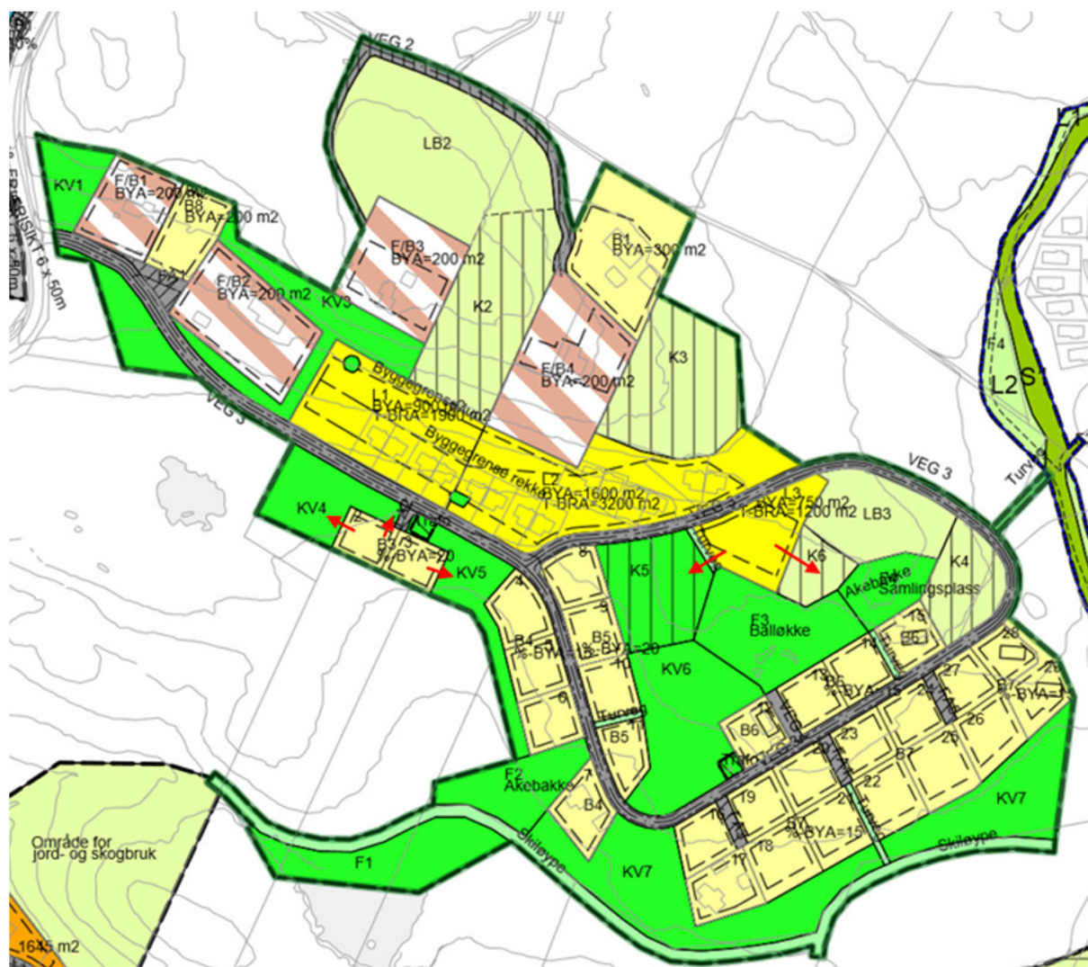
Fig.4: Gjeldande reguleringsplan for Klyppemyrhaugen. Moglege utvidingar av B3 og L3 er markert med raude piler.

Reguleringsplan for Klyppemyrhaugen, vedteke 12.12.2002, er gjeldande plan for området.