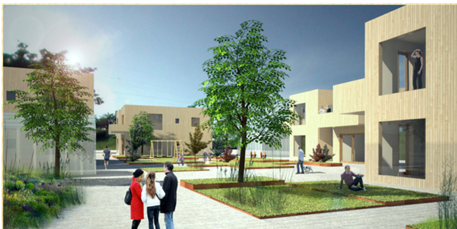
Fig.3: Utsnitt som viser ønska bygningstype frå tiltakshavar