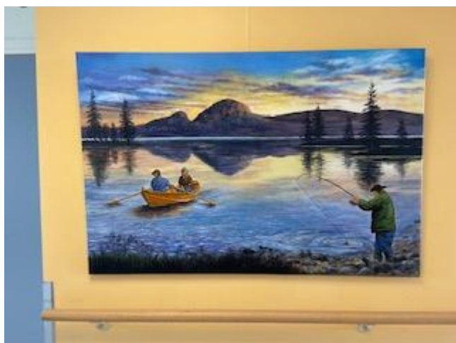
heng i korridor