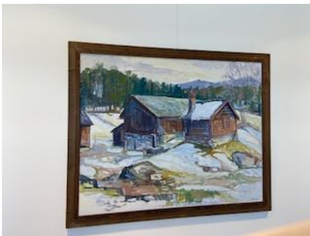
heng i stogo B

Sigmund har hatt utstillingar mange stader i Norge, og også i Sverige, Island, Tyskland, Austerrike, Sveits, England, Spania og Amerika.