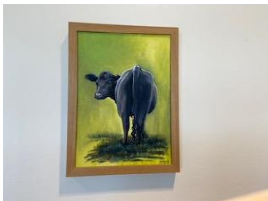
heng på stogo B