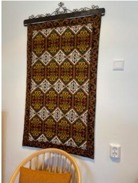
Sjåk-åkle Gitt av Borghild Robøle