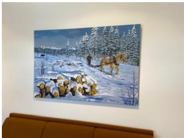
heng på stogo A