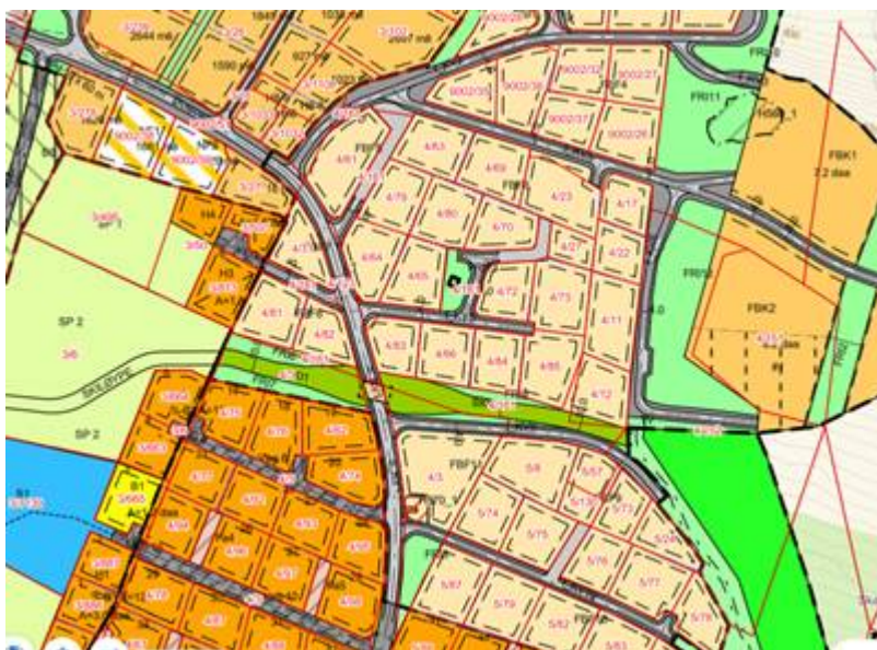
Figur 2. Område sett av for tilførselsløype frå sentrum med kryssing av Øvrevegen.

I reguleringsplanen er det også lagt inn ei tilførselsløype frå sentrum til Raud 1, som skal krysse Øvrevegen (Figur 2).