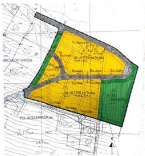
Figur 4: Øvst frå venstre: Reguleringsplanforslag