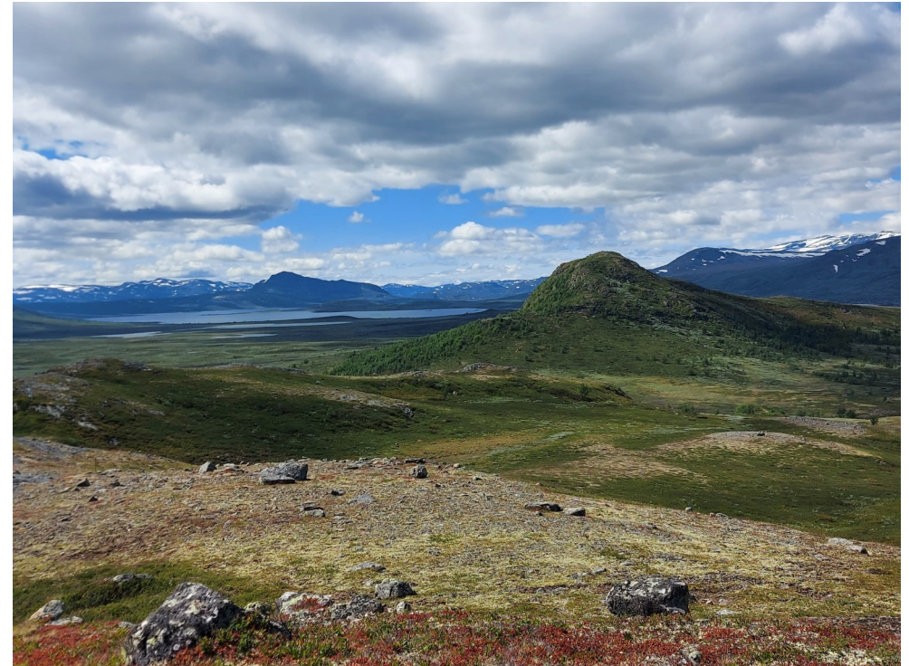
Perstjernhøgde er eit av turmåla i år. Her med utsikt mot Keisaren.

Øystre Slidre idrettslag - trim- og friidrettsgruppa og Rogne idrettslag