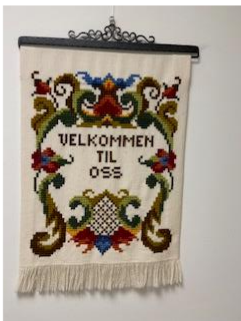
Broderi frå gamle sjukeheimen