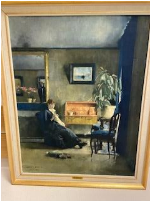
heng i korridor

Harriet Backer 1845-1932 Blått interiør. Harriett Backer er ein av Norges store kunstnarar og vann fram tiltross for at ho var kvinne. Ho var spesielt oppteken av farger og korleis lyset fanga fargane.