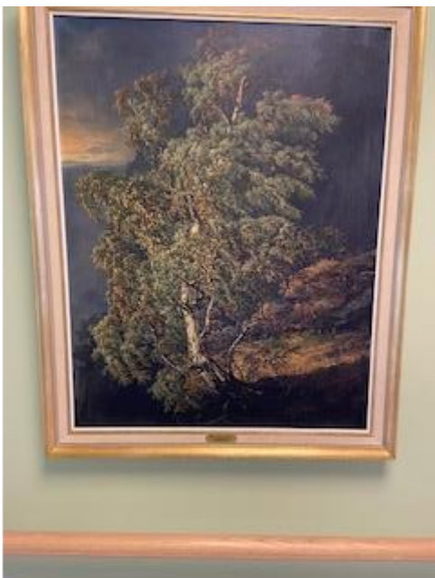
heng i korridor

Harriet Backer 1845-1932 Blått interiør. Harriett Backer er ein av Norges store kunstnarar og vann fram tiltross for at ho var kvinne. Ho var spesielt oppteken av farger og korleis lyset fanga fargane.