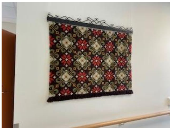
Veggteppe laga av Kjellaug Lund