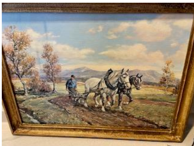
ukjent , heng i stogo B