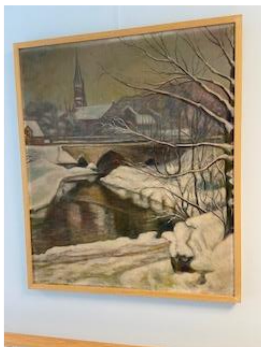
frå gamle sjukeheimen heng i korridor