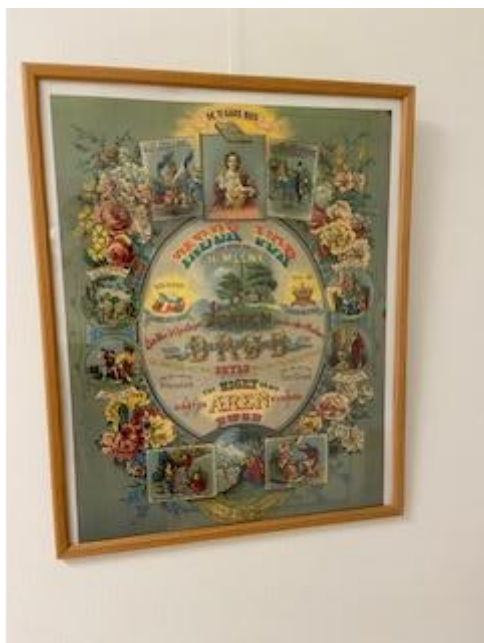
Bilde frå gamle sjukeheimen.