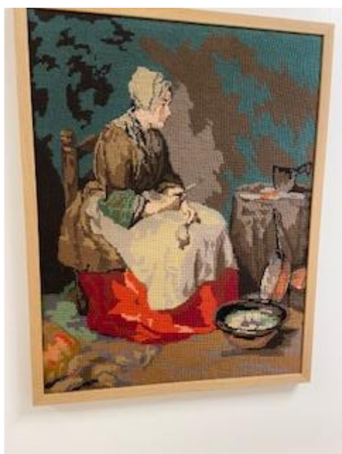
Broderi, gjeve i gåve frå pårørande på Kårstogo i gamle sjukeheimen