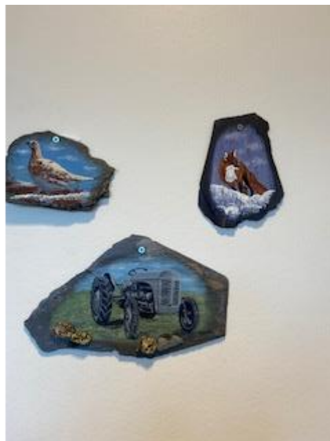
Dyremotiv på skiferheller