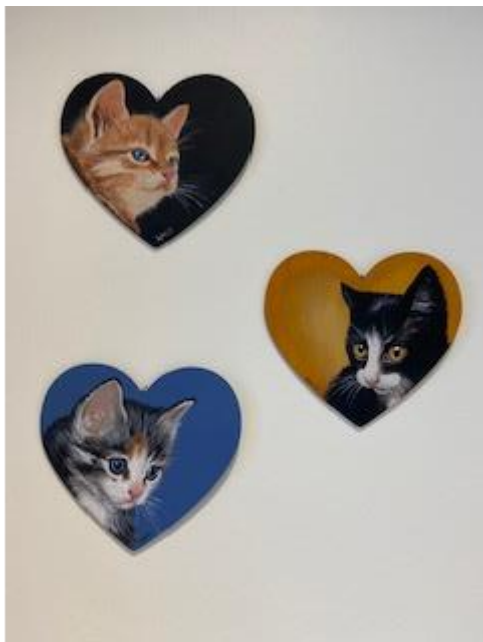
Kattmotiv, akryl på tre

Bestillingsverk der motiv er henta frå stølsmiljø i Øystre Slidre på 60-talet. Akryl på lerett.