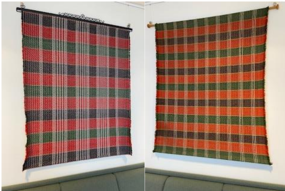
Heng i stogo A

Info om kunstverk: kristneteppe vevd i skillbragd. Stripar i raudt, grønt og brunt med kvite innslag mellom stripene. I kvar raud stripe er det smetta inn ein fem grønne firkantar på tvers, i den brune og grønne er det smetta inn fire firkantar med raudt. Sydd saman av to lengder med saum på midten. Mulig restar etter frynser frå innslag av ull i jarekantane. Falda med maskin.