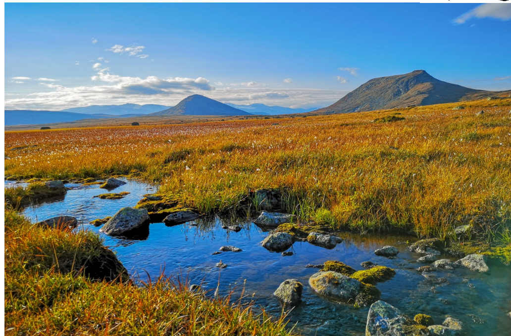
Bilete som syner Gluptindane, som er eit av turmåla i år.

Skilta ruter til 12 fine utsiktspunkt i Øystre Slidre. Turar for heile familien – bli med du også!