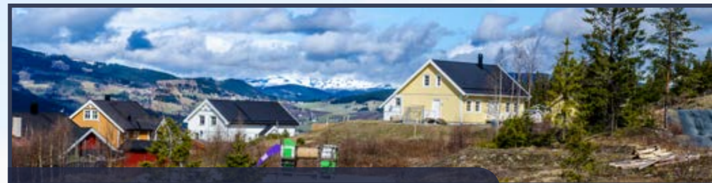
Solhauglie har panoramautsikt og sol frå morgon til kveld.

HELSE Helsestasjon 15 km Legekontor 15 km Valdres lokalmedisinske senter 13 km